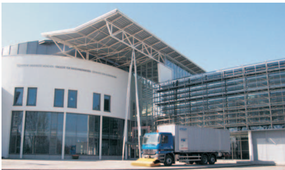
Vor dem futuristischen Tagungsgebäude wurde einer der beiden automatisierten LKW vorgeführt